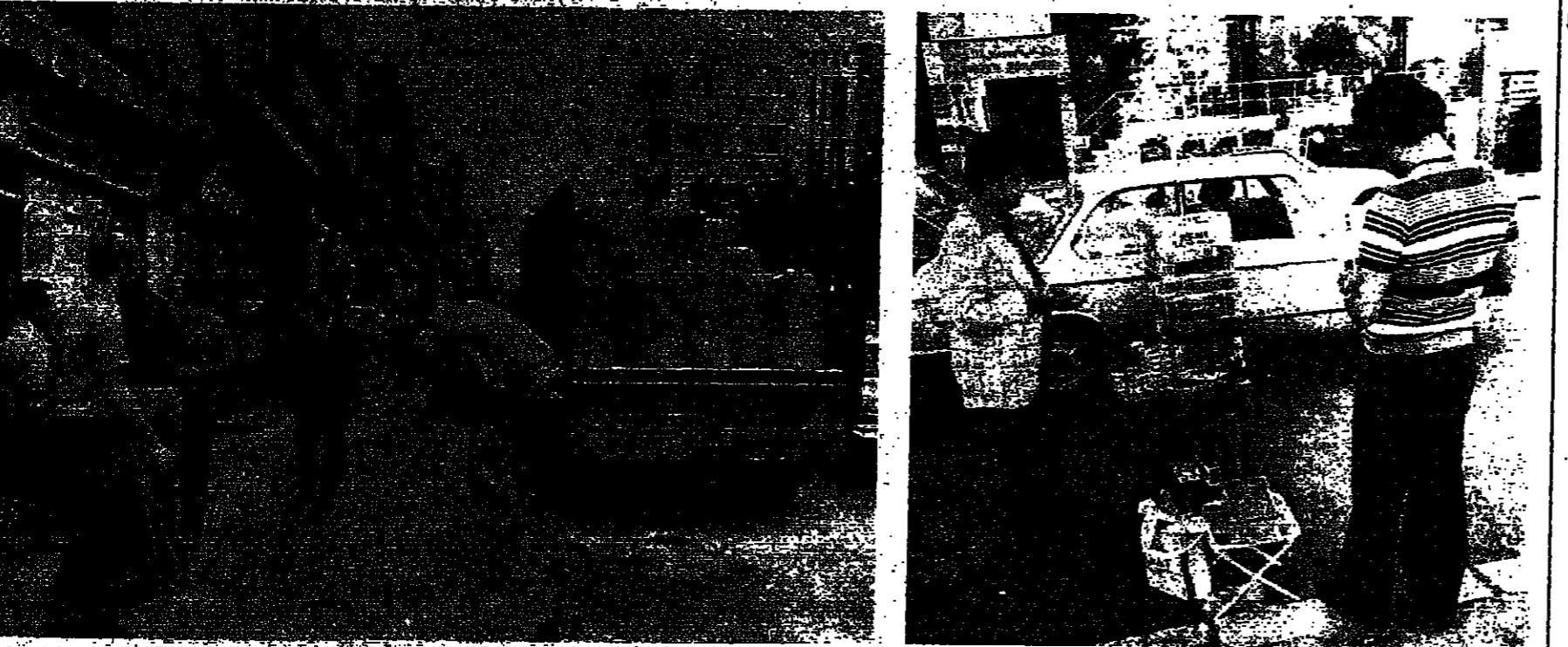
الخان المهرت متوقف بكرة .. ولكن الاسعار باروناع مستمر